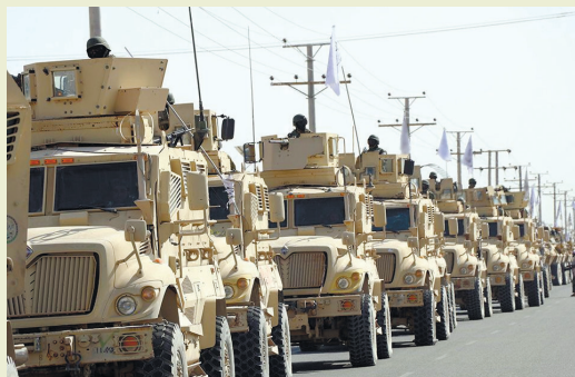
Окончание. Начало на стр. 5

В докладе швейцарско-итальянского политика и юриста Дика Марти «Змей» назван руководителем «криминальной группы косовских албанцев, которые занимаются контрабандой оружия, запрещенных веществ и человеческих органов».